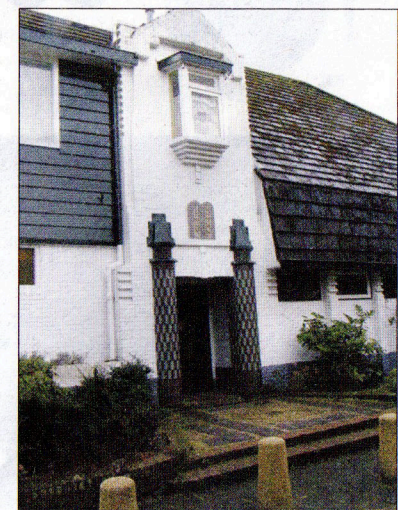
De huidige synagoge aan de Kromme Englaan.